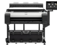
imagePROGRAF TM-300 MFP Z36