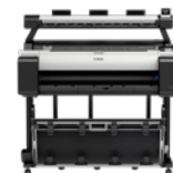
imagePROGRAF TM-300 MFP L36ei